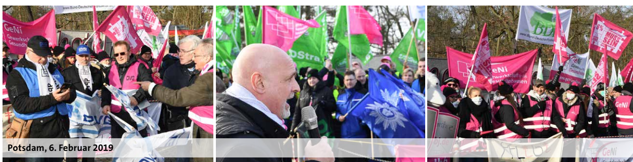
Potsdam, 6. Februar 2019

Nachdem der enttäuschende Verlauf der Verhandlungen analysiert worden war, hat die Verhandlungskommission des dbb beschlossen, den Druck auf der Straße zu erhöhen und die Warnstreiks zu inten