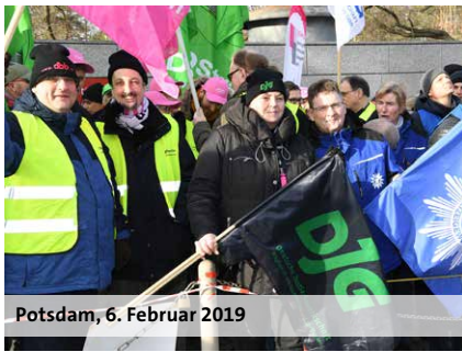
Potsdam, 6. Februar 2019