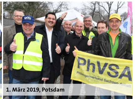
1. März 2019, Potsdam